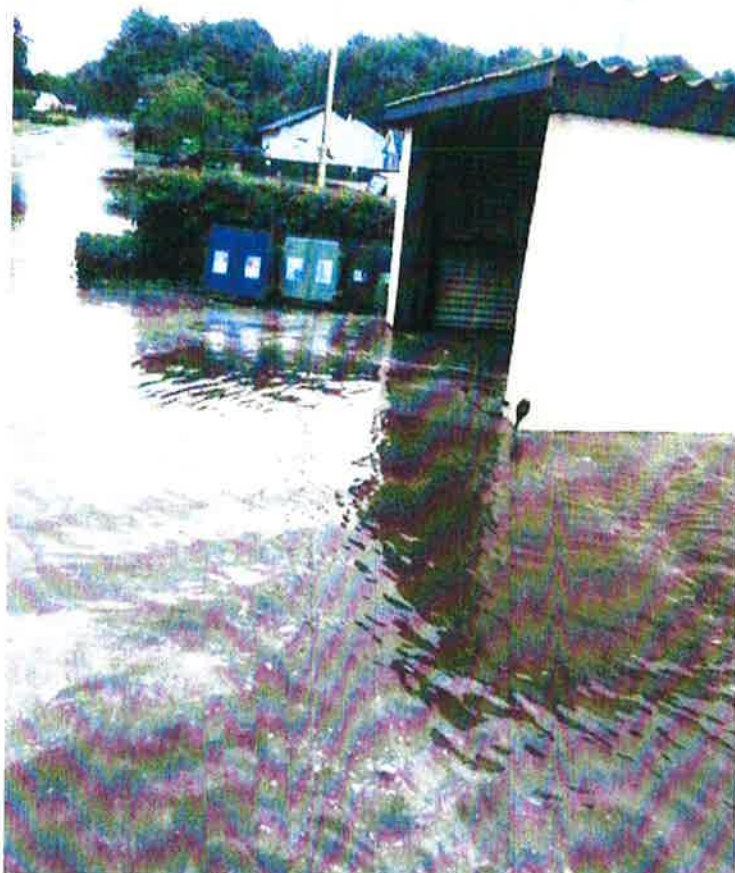
Oversvømmet Stenderupvej ved nr. 10 den 26. juni 2024