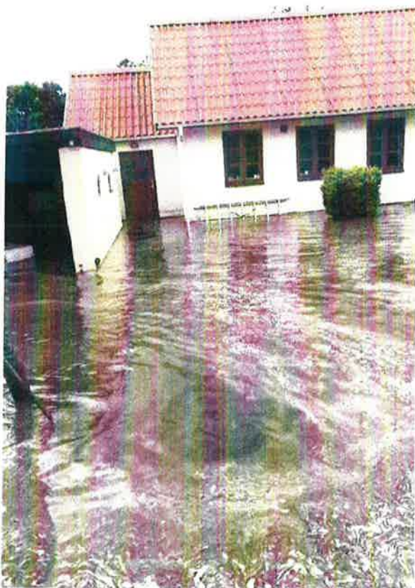
Stenderupvej 10 den 26. juni 2024

Dybdepunktet ved Stenderupvej 10 modtager overfladevand fra et ca. 53 ha stort topografisk opland nord for Stenderup og ca. 780 l.bm vejareal af Stenderupvej.